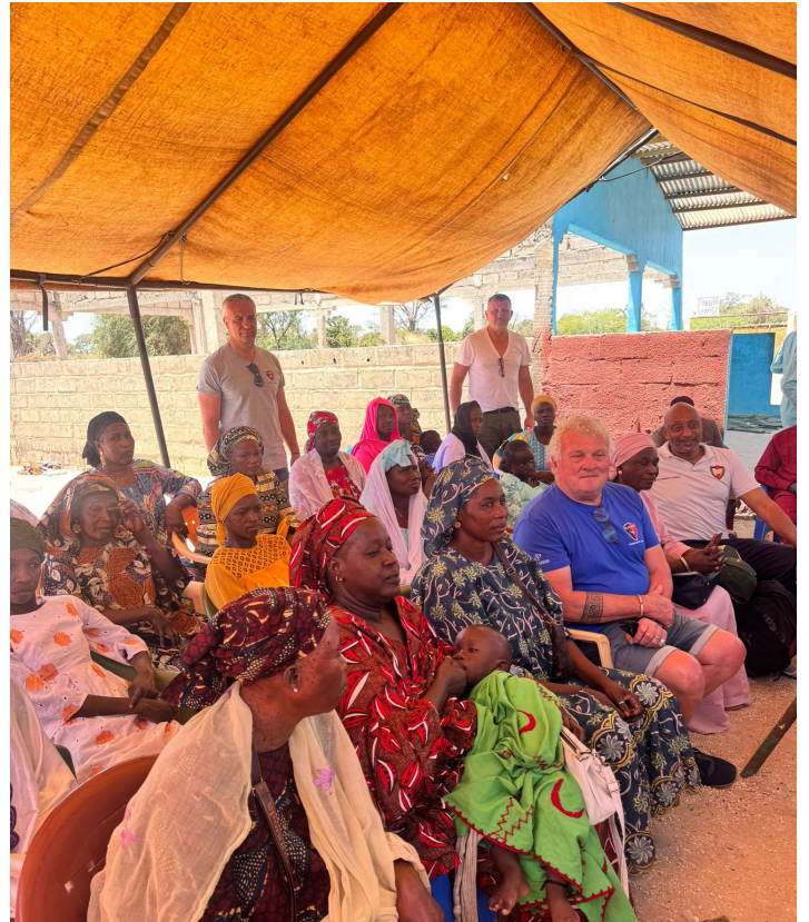
À l'association de quartier à Kaolack