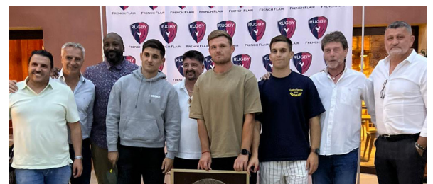
le 11 juin à l'Hospitalet à Narbonne

• Rendez-vous à Toulouse pour la 8ème édition de l' Eden Park WaterRugby du 2 au 5 juillet. Comme chaque année, nous vous attendons sur le stand de l'association.