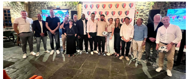
le 21 avril au restaurant Mariposa à Pau

À chacune de ces rencontres, de nombreux joueurs et chefs d'entreprise locaux viennent partager leur passion du rugby. Ces événements sont l'occasion de recueillir des fonds qui financent nos actions auprès des enfants.