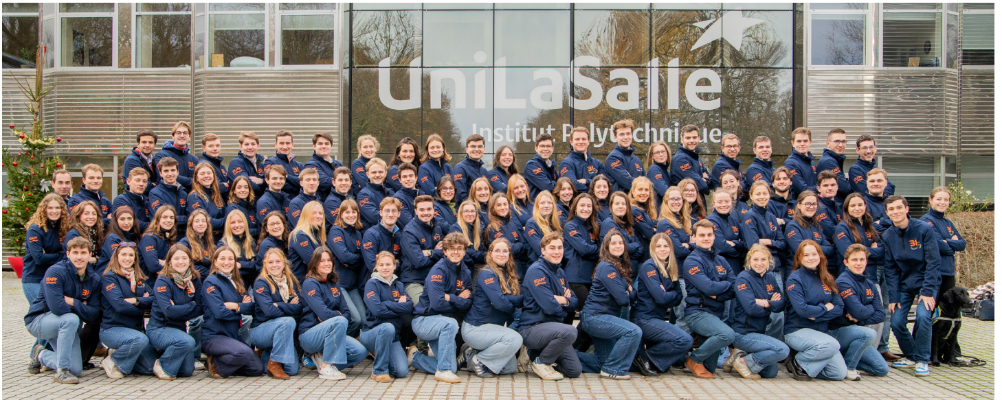
Les étudiants organisateurs de l'édition 2026

Depuis 1995, ce tournoi universitaire fait vivre trois valeurs fortes : l'amitié, la sportivité et la générosité. Historiquement tournées vers le rugby, les Ovalies regroupent aujourd'hui plusieurs compétitions : rugby à XV masculin, rugby à VII masculin et féminin, rugby en fauteuil, mais aussi concours de pompoms, mascottes et supporters.