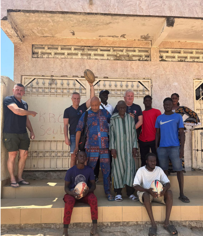
À l'école de rugby de Koutal