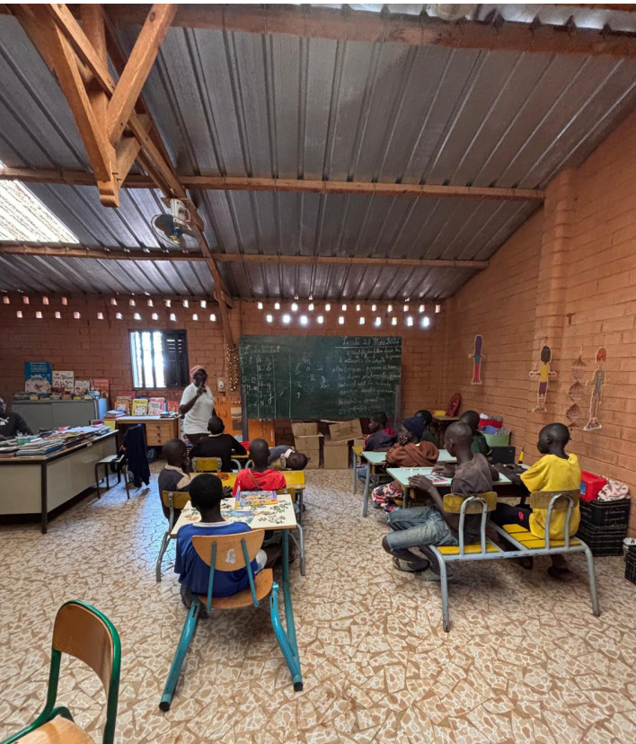
À l'association Village Pilote à Dakar

En mars dernier, nous nous sommes rendus au Sénégal afin de préparer notre mission générale de novembre prochain.