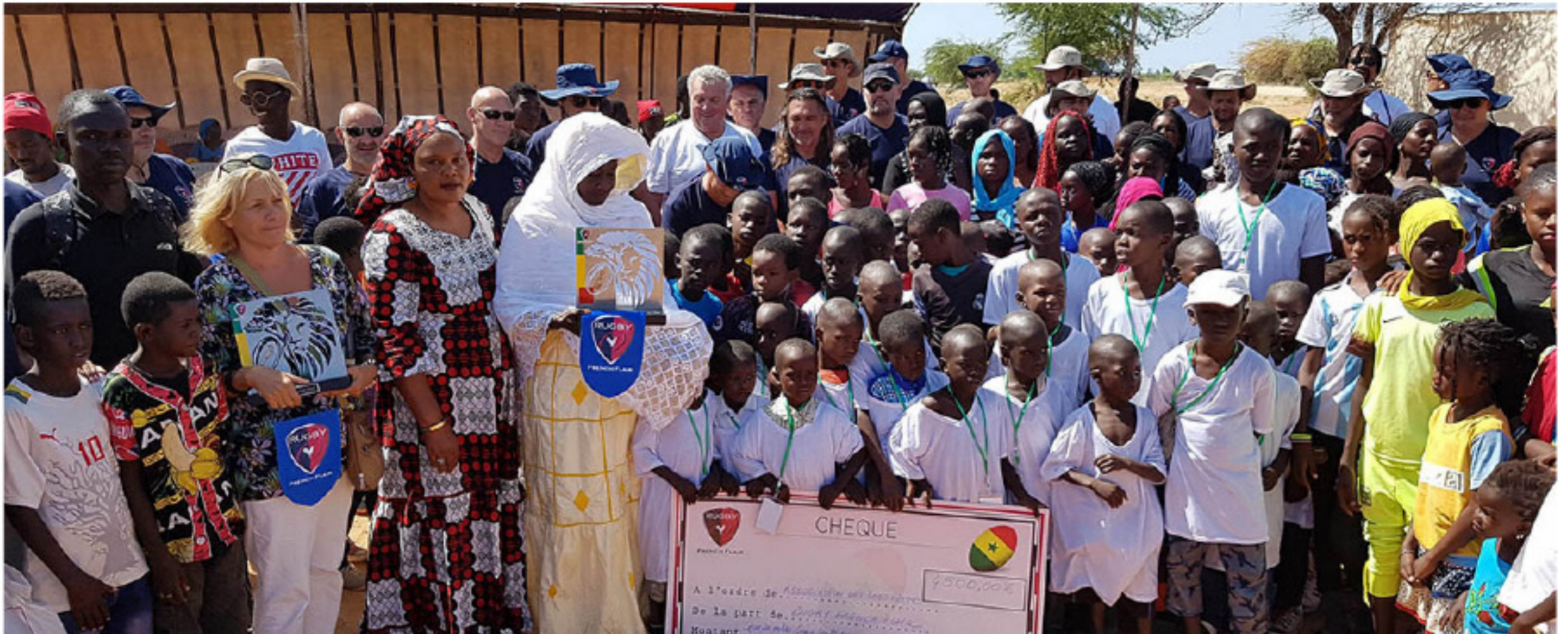
Les membres de l'Association des 3000 femmes et de Rugby French Flair lors de la remise de notre don en Novembre 2018

C'est l'une des associations que nous avons choisi d'aider lors de notre mission au Sénégal en Novembre 2018. Nous y avons passé une journée en remettant une dotation financière de 4500 €, en plantant un baobab et 25 cocotiers, en posant la première pierre du vestiaire du terrain de sport que nous co-finançons avec des entreprises françaises et aussi, évidemment, en initiant les enfants à la pratique du rugby !