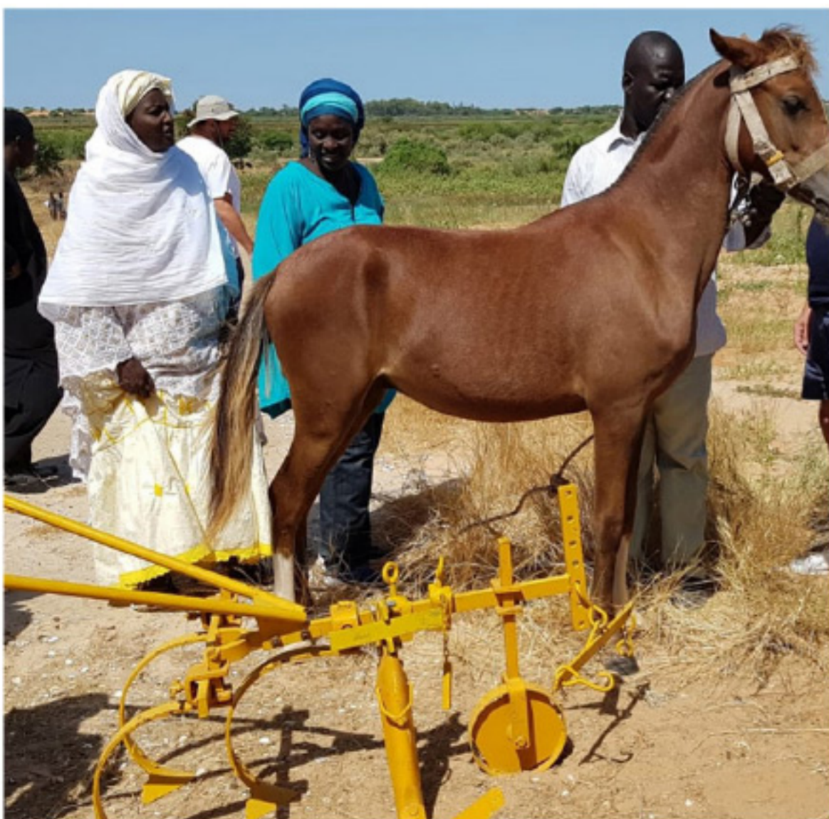
Le cheval et la charrue financés par notre association

Notre soutien a fait gagner à cette organisation deux ans d'avance sur leur plan de développement.