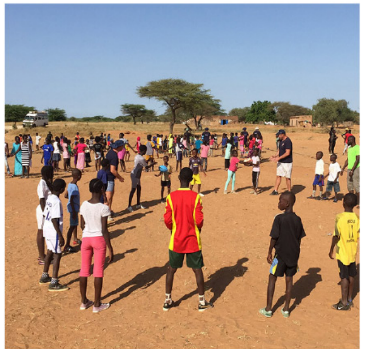
Initiation à la pratique du Rugby