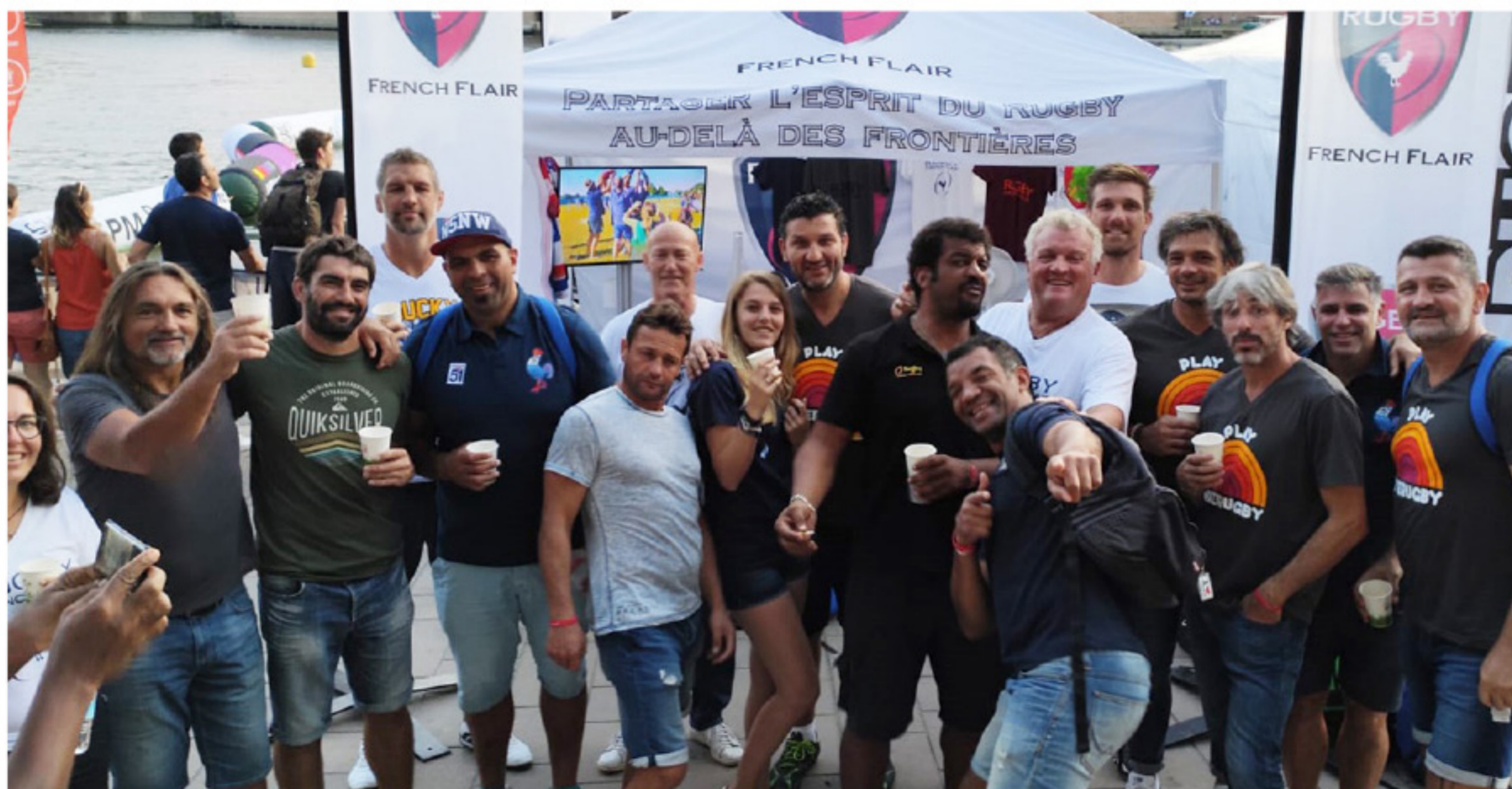
Une représentation en nombre sur le stand Rugby French Flair

Les 13, 14 et 15 Septembre derniers, nous étions sur les quais de la Garonne pour ce premier WaterRugby à Toulouse ! Sous un temps estival, de nombreux amateurs et plus de 30 anciens internationaux se sont affrontés lors de matchs joués sur un terrain flottant. Les organisateurs du tournoi, Yann Delaigue en tête avec Cédric Desbrosse et Francis Ntamack , ont réservé un espace particulier à notre association pour 3 jours de belles rencontres et de contacts intéressants, avec de nouveaux joueurs pour nous, ainsi que des partenaires actifs de notre association, ou en passe de l'être.